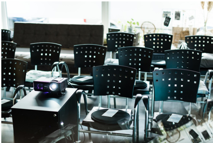
(Location: Roommates)